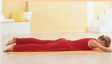
2 Na každou stranu 3krát