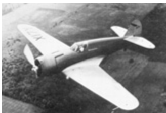
Prototyp H-75 absolvoval většinu zkoušek s motorem Twin Wasp Junior. Typickým znakem tehdejších konstrukcí byla možnost zaměřovat pohonné jednotky. V případě Hawku 75 používaly hvězdicové motory Cyclone a Twin Wasp, zkusily se i motory řadové.

Výsledkem již tedy elegantní samonosný dolnoplošník se zatahovacím podvozkiem a zcela zakrytou kabinou a se čtrnáctiválcovým dvohvězdicovým motorem Wright XR-1670S o výkonu 700 koní. Výzbroj tvořila pouhá dvojice synchronizovaných kulometů na horní části trupu. To bylo sice málo, odpovídalo to ale požadavkům zadavatele.