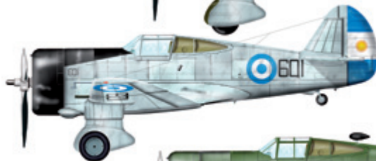
12. Hawk 750 1. skupina, Argentina, 1942