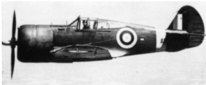
Britský Mohawk Mk.IV za letu. Na rozdíl od předchozího snímku se široký žlutý lem trupového znaku na tomto snímku jeví jako světlý.

Britové přidělili letounům své vlastní označení, bojové jméno Mohawk. Letouny byly podle typu rozděleny do čtyř modifikací. Mimořádně ani