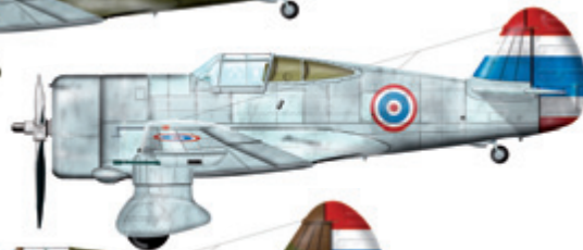
9. Hawk 75N 60. peruť, Thajsko, 1941