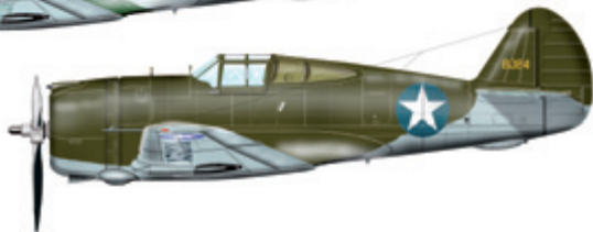
6. Curtiss P-36A USA, konec 1942