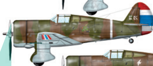
10. Hawk 75N 60. peruť, Thajsko, 1941