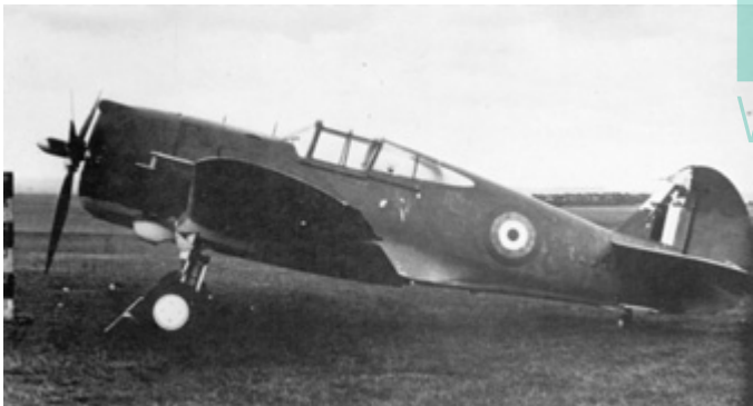
Přestože největší význam pro Brity měly Mohawky Mk.IV (H-75A-4), britské barvy neslo i několik letounů verzí A-1, A-2 a A-3. Stroj na snímku (AR634) nese již britské znaky, patrně jsou ale stopy značně opožděného francouzského kamuflážního nátěru. Všimněte si typického znaku černobílých snímků z tohoto období – široký žlutý lem trupového znaku se kvůli zestárnutí fotografie jeví jako černý!

Na podzim 1941 prodali Britové 16 Mohawků Mk.IV Portugalsku, naopak další letouny této (skoro) verze získali. Došlo k tomu po okupaci Iránu v srpnu 1941, kde Britové zabavili devět nových H-75A-9 (s persky popsanými přístroji), které zařadili do výzbroje pod označením Mohawk Mk.IV. A když továrna Hindustan Aircraft Limited v indickém Bangalore v roce 1942 dokončila prvních (a jediných) pět strojů původní čínské verze H-75A-5, rovněž s motorem Cyclone, zařadili je Britové do výzbroje také jako Mohawk Mk.IV.