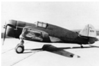
H-75B s motorem Cyclone neuspěl v soutěži roku 1936

Třetí soutěže se opět zúčastnily pouze Severského a Curtissův typ. Northropovo letadlo bylo jednoznačně označeno za příliš těžké a velké na to, aby mohl být přepracováno na jednomístnou stíhačku,